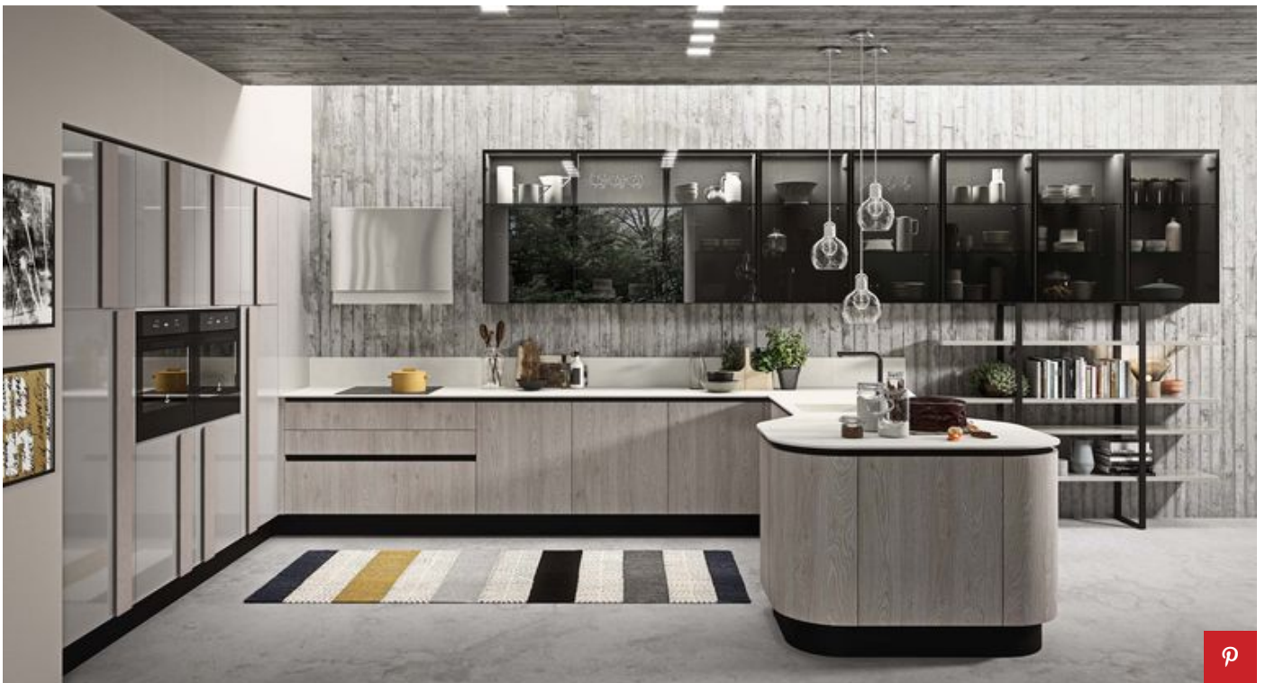
Cucina Erika di Aran Cucine Aran Cucine

PUBBLICITÀ - CONTINUA A LEGGERE DI SEGUITO