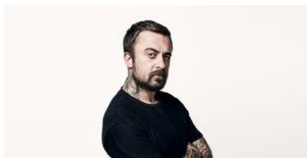
NELLA CUCINA (SENZA FRIGO?) DI CHEF RUBIO