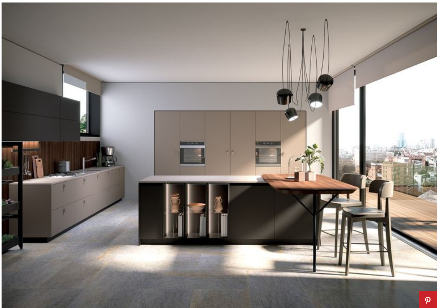
Cucina EGO di Febal

PUBBLICITÀ - CONTINUA A LEGGERE DI SEGUITO