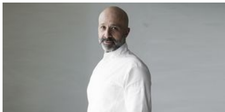
NIKO ROMITO, IL CUOCO CHE VOLEVA FARE IL BANCHIERE