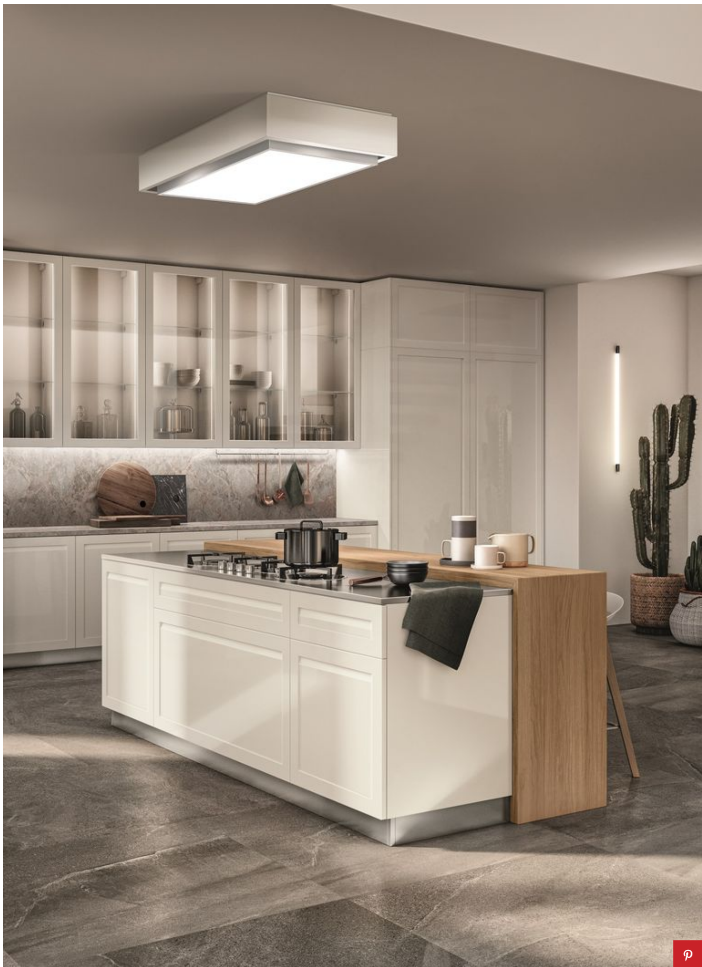
Cucina Carattere di Scavolini

sportelli delle ante si dotano di tecnologia soft-close , a chiusura rallentata. L'innovazione più preziosa è il led nascosto nella scanalatura all'interno della cucina, che può essere comandato a distanza da smartphone o tablet.