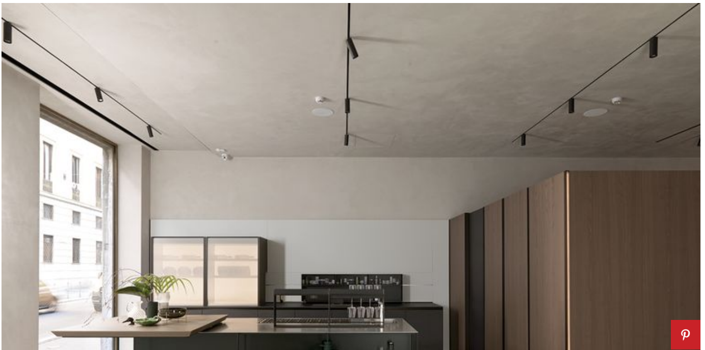
Cucina Telero di Euromobil

La Telero di Euromobil , cucina icona del brand , si ispira ai telai veneziani del Cinquecento e si rinnova, quest'anno, con le antine in alluminio sulle quali fissare elementi in vetro o in gres porcellanato. Gli effetti di monocromaticità e monomatericità completano la linea, aggiornando la cucina nelle facciate ampliate dalla nuova collezione di vetri, in nove varianti, denominata Dekor . Fra le novità, si inseriscono le basi a giorno Image - presentate durante l'edizione 2018 di Eurocucina. La preparazione del cibo si trasforma in un momento fluido, ponte fra show-cooking e pranzo, grazie a due elementi scorrevoli che rendono l'arredo dinamico e tecnologico: Ambrogio e Motus . Il primo è un contenitore sopra top dotato di chiusura avvolgibile motorizzata e schienale retroilluminato (realizzato con il materiale utilizzato per le schermature solari); il secondo è l'elemento scorrevole dietro al piano, che funge da supporto dei vari utensili, conservandoli a portata di mano.